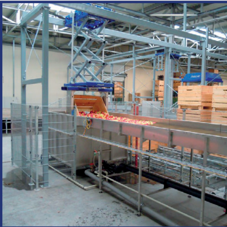
Portalentleerer mit Kippeinrichtung