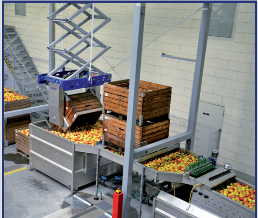
Portalentleerer für zwei Packlinien

Software für Sortiermaschinen. Auch zum Nachrüsten.